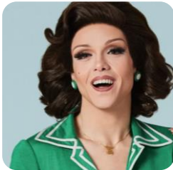
Rita Von Hunty